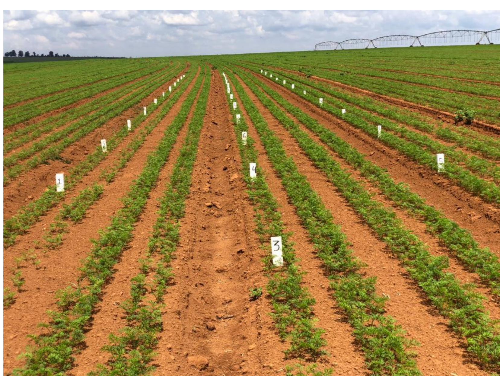
Figura 01: Imagem mostrando a distribuição das parcelas em campo. Patos de Minas, 2021.

As aplicações foram realizadas com auxílio de bomba costal elétrica com bico cônico e vazão de 350 L ha -1 e as avaliações foram feitas no final do ciclo de plantio (com 111 dias após o plantio), foram desconsideradas as bordaduras e utilizado somente 1 (um) metro central de cada parcela. A variável que foi avaliada foi peso de raiz da cultura. A análise estatística dos resultados foi realizada com o auxílio do programa STATISTICA. O mesmo utilizado para as análises de variância (ANOVA) e para a análise de comparação de médias por meio do teste de LSD (p < 0,05).