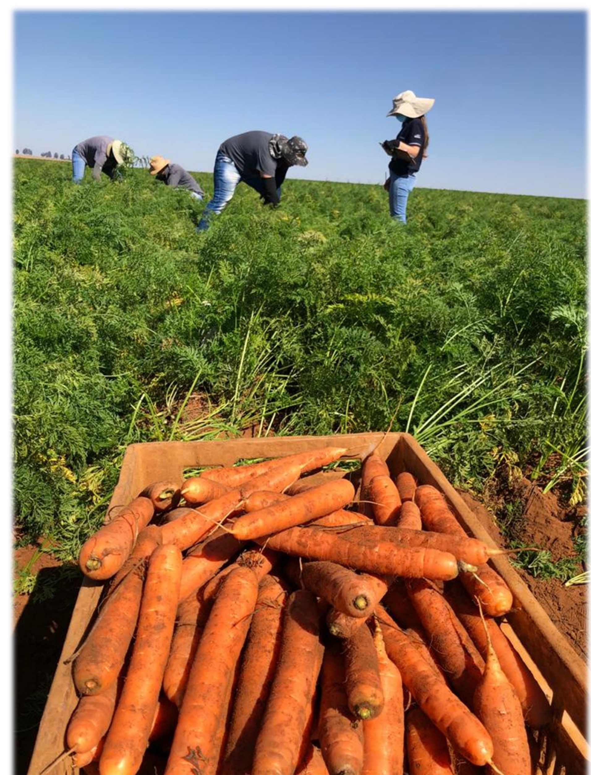
Figura 25: Colheita do experimento de forma manual.

* ns: não significativo ao teste de F. Obs: os tratamentos 2, 3 e 4 foram aplicados no plantio e 25 dias após o plantio via barra. Os tratamentos 5 e 6 foram aplicados aos 25 e 45 dias após o plantio via barra.