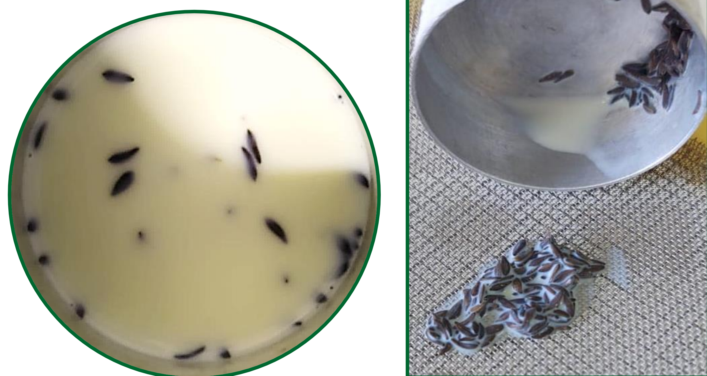
Figura 1. Tratamento de sementes de alface com soluções aquosas de óleo de laranja. UENP/CLM, Bandeirantes/PR, 2022.

O estudo foi realizado no Laboratório de Análise de Sementes da UENP/CLM, com quatro lotes de sementes de alface cv. ‘Simpson’, isentos de tratamento sanitário; imersos durante oito minutos em soluções aquosas de óleo essencial de laranja a 10% (m.m -1 ) (Figura 1).