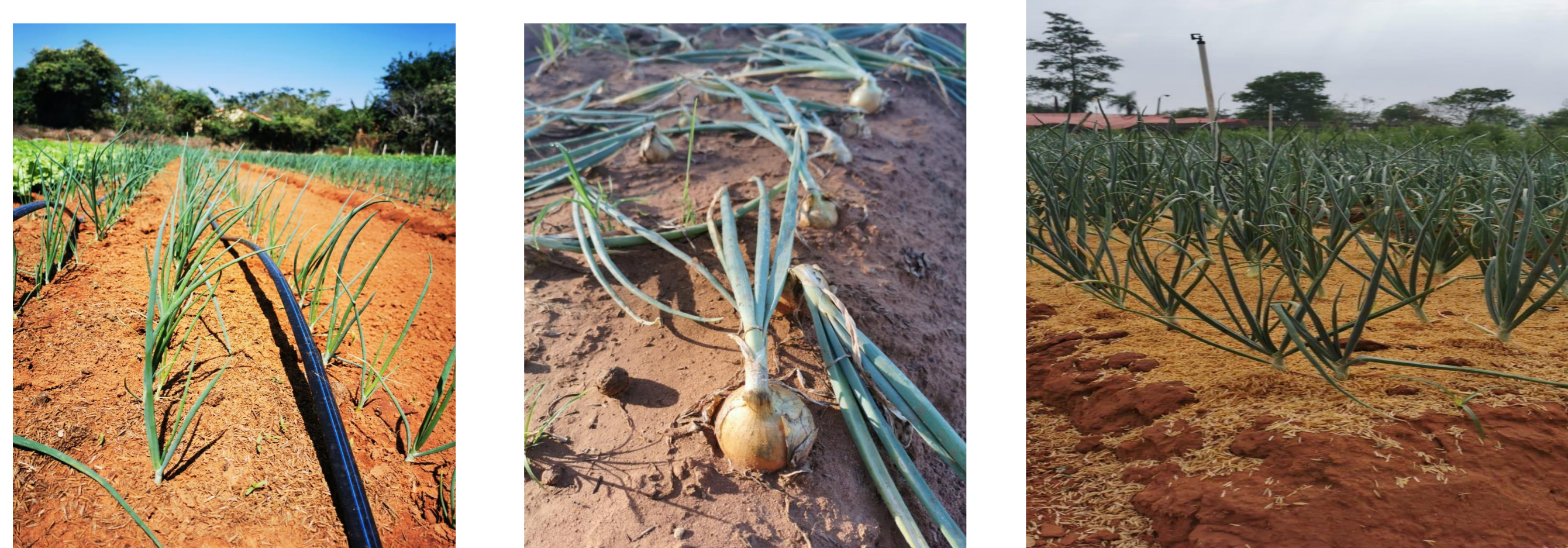
Figura 1: Registro fotográfico del experimento de cebolla de bulbo en dos sistemas de riego con diferentes coberturas de suelo. J. Augusto Saldívar, CAD/FCA. Py. 2020.

Cada unidad experimental estuvo constituida por cuatro hileras de 80 plantas, totalizando 320 plantas, en un área de 8 m 2 (1 m x 8 m), de esta forma el área del experimento tuvo una dimensión total de 288 m 2 incluido los camineros (0,50 cm) entre tablones, teniendo una población total de 7680 plantas. Las variables evaluadas fueron: peso medio de bulbo, rendimiento de bulbo, diámetro y longitud del bulbo, altura y número de hojas (un). Los datos fueron analizados utilizando el paquete estadístico INFOSTAT.