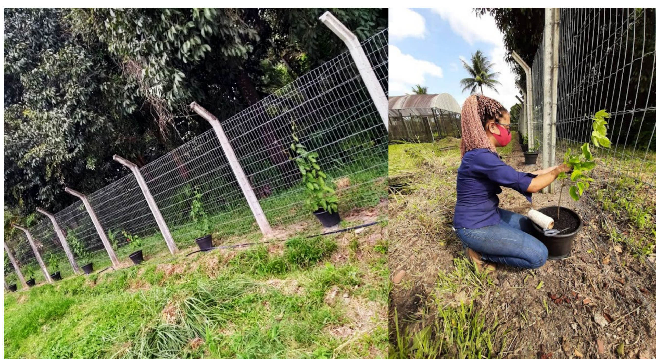
Figura 2 - Montagem do experimento

Em setembro de 2021 foi realizado o plantio das mudas (estacas) em vasos de 12L e mantidos a meia sombra proporcionadas por árvores existentes próximo a área experimental. As análises foram realizadas semanalmente até junho de 2022, quantificando os botões florais e flores abertas.